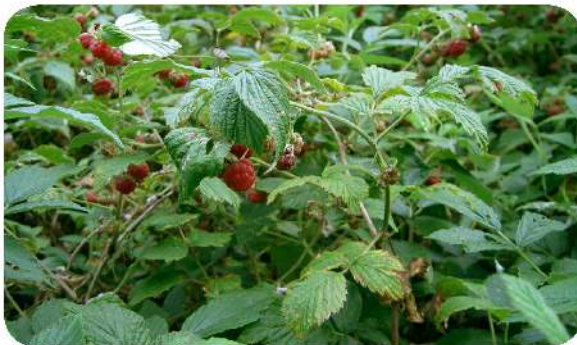
Framboisier ( Rubus idaeus )

Tige : dressée, brun clair à glauque Feuilles : alternes, 3 à 7 folioles, vert dessus, blanc dessous