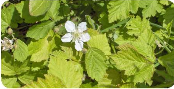
Ronce des bois ( Rubus fruticosus )

Feuilles : alternes, de 3 à 5 folioles dentées Fleurs : régulières, blanches à roses