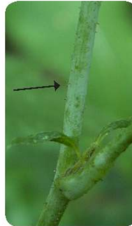
Ronce bleue ( Rubus caesius )

Fruits : rouges puis noirs à maturité, en grappe terminant les rameaux