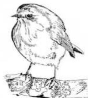
Popeye, le rouge-gorge

Si tu poses un nichoir, tu aides les oiseaux à faire leur nid en remplaçant les vieux murs de pierres et les arbres creux qui disparaissent.